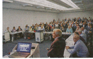
▲国際評価委員会による審査の様子

審査にあたっては、事前に加盟各国の団体から「品質管理」「環境対策」「ビジネスモデルとサービスクンセプト」「技術革新」「事業の基本方針」の5項目に関するレポー